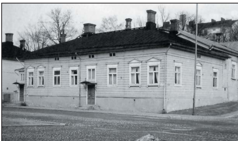
Över hundra år senare stod hörnhuset vid Biskopsgatan och i Agricologatan fortfarande i sin ursprungliga form frånsett den nya dörren mot Biskopsgatan. Foto år 1958.

Teckning efter mönsterböcker och gipsmodeller utgjorde under Ekman s tid fortfarande grunden i undervisningen. Bland de nyare mönsterböckerna kan nämnas Magnus von Wrights "Grunder i Teckna och Rita" från 1858.