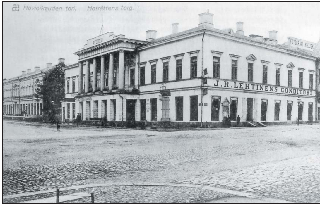
Domkyrkotorget 3, nuvarande Åbo Akademis huvudbyggnad fotograferad kring 1900. Åbo Ritskolas sista hemvist i Biskopsgatsområdet 1877-1904.

konstutställning, som därefter återkom årligen och var också öppen för allmänheten.