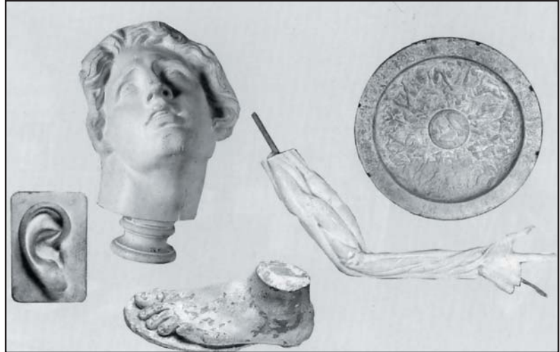
Gipsmodeller som användes i Ritskolans undervisning på 1800-talet.

Ekman föddes i Nystad, blev föräldralös redan som tioåring och sökte sig som sextonåring till konstakademien i Stockholm tillsammans med sin äldre bror Fredrik. Brodern avbröt studierna efter några år men Robert Wilhelm var mycket