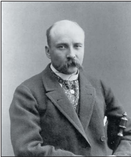
Victor Westerholm (1860-1919) föreståndare 1888-1898 och 1904-1917.